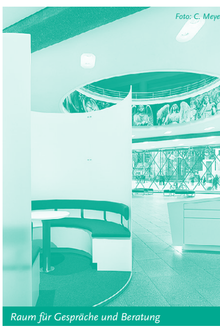
Raum für Gespräche und Beratung